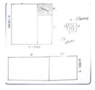
Gambar 3. Hasil pekerjaan siswa pada permasalahan 2

Dengan memecahkan masalah tersebut, siswa memahami bahwa dengan melakukan manipulasi geometris dengan metode Naïve Geometry , panjang persegipanjang diperoleh dengan menambahkan sisi persegi terbentuk di awal dengan sisi yang dipotong dari persegi (dibuang untuk mencocokkan area persegi panjang yang diinginkan ). Karena sisi persegi yang terbentuk di awal adalah 10 unit dan sisi persegi yang dihilangkan adalah 4 unit, dimensi persegi panjang adalah 10 + 4 = 14 (panjang) dan 10 - 4 = 6 (lebar).