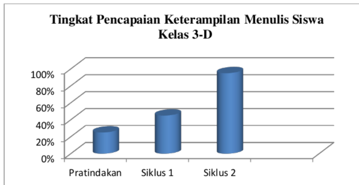
Gambar 2. Diagram Perkembangan Pencapaian Keterampilan Menulis Siswa Kelas 3-D

tindakan untuk penelitian ini dapat dilihat pada diagram batang berikut.