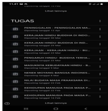
Gambar 2. Google Classroom berupa judul materi-materi mata pelajaran IPS