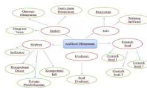
Gambar 5. Flowchart