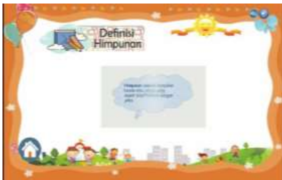
Gambar 8. Sebelum perbaikan pada materi yang disajikan