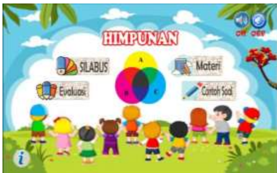
Gambar 10. Sebelum perbaikan pada kontras font button