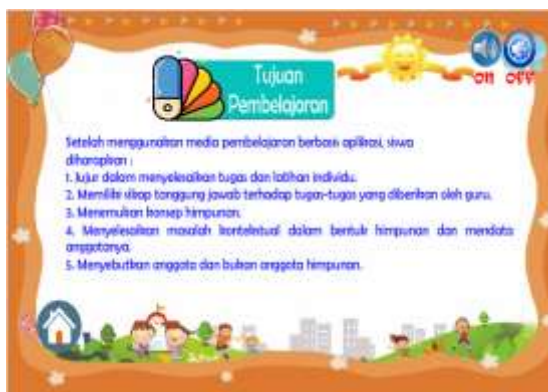
Gambar 13. Sesudah perbaikan pada penulisan peserta didik menjadi siswa dan pendidik menjadi guru