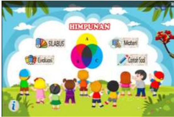
Gambar 6. Sebelum perbaikan pada interaksi peserta didik dengan pendidik dan peneliti