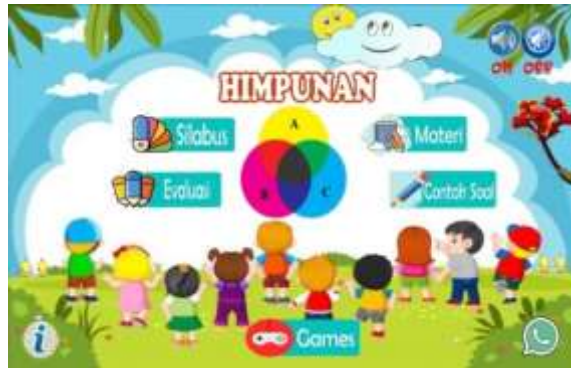
Gambar 7. Setelah perbaikan pada interaksi peserta didik dengan pendidik dan peneliti dengan menggunakan aplikasi Whatsapp