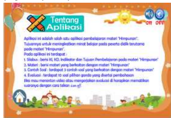
Gambar 16. Sebelum perbaikan pada kata asing yang dimiringkan dan akhir kalimat diberi tanda (.)