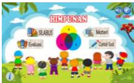
Gambar 2. Halaman menu