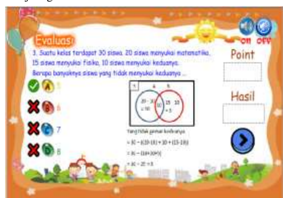
Gambar 14. Sebelum perbaikan pada kata verba yang tidak tepat (menyukai)