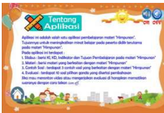
Gambar 17. Sesudah perbaikan pada kata asing yang dimiringkan dan akhir kalimat diberi tanda (.)

Media pembelajaran berbasis aplikasi android layak untuk diujicobakan oleh ahli materi, media, dan bahasa. kemudian media pembelajaran berbasis aplikasi android akan diujicobakan kepada praktisi dan peserta didik.