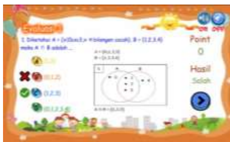
Gambar 4. Halaman soal evaluasi