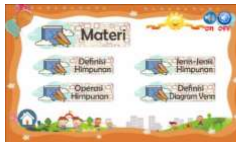
Gambar 3. Halaman materi