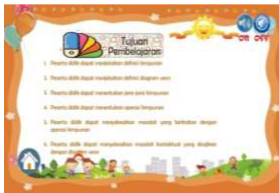
Gambar 12. Sebelum perbaikan padapenulisan peserta didik menjadi siswa dan pendidik menjadi guru