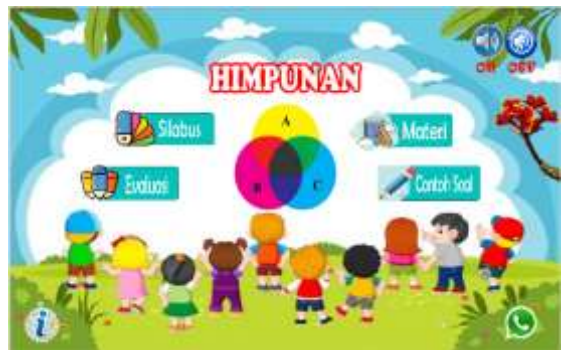
Gambar 11. Setelah perbaikan pada kontras font button