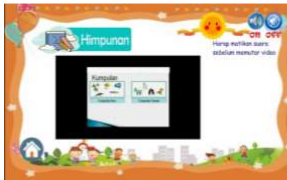
Gambar 9. Sesudah perbaikan pada materi yang disajikan