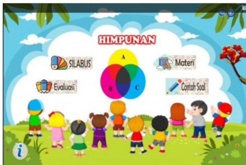
Gambar 6. Sebelum perbaikan pada interaksi peserta didik dengan pendidik dan peneliti

Revisi media pembelajaran berbasis aplikasi android berdasarkan masukan dan saran dari ahli dapat dilihat pada Gambar 6 sampai dengan Gambar 17.