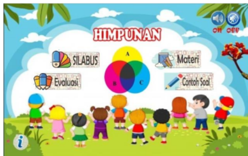
Gambar 10. Sebelum perbaikan pada kontras font button