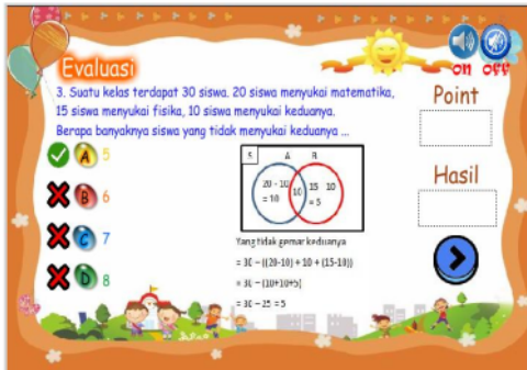
Gambar 14. Sebelum perbaikan pada kata verba yang tidak tepat (menyukai)