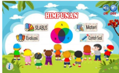
Gambar 2. Halaman menu