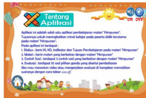
Gambar 17. Sesudah perbaikan pada kata asing yang dimiringkan dan akhir kalimat diberi tanda (.)

Media pembelajaran berbasis aplikasi android layak untuk diujicobakan oleh ahli materi, media, dan bahasa. kemudian media pembelajaran berbasis aplikasi android akan diujicobakan kepada praktisi dan peserta didik.