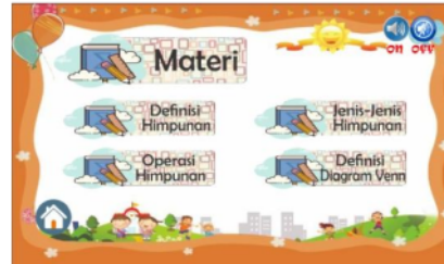
Gambar 3. Halaman materi