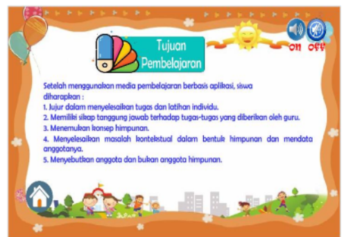
Gambar 13. Sesudah perbaikan pada penulisan peserta didik menjadi siswa dan pendidik menjadi guru