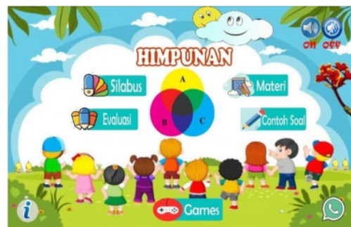
Gambar 7. Setelah perbaikan pada interaksi peserta didik dengan pendidik dan peneliti dengan menggunakan aplikasi Whatsapp