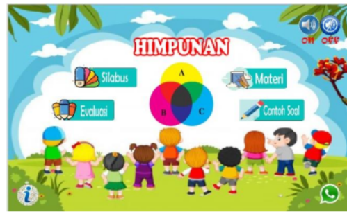
Gambar 11. Setelah perbaikan pada kontras font button