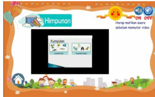
Gambar 9. Sesudah perbaikan pada materi yang disajikan