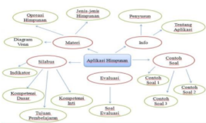
Gambar 5. Flowchart