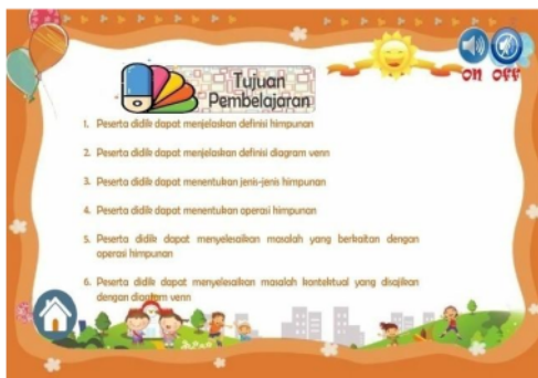
Gambar 12. Sebelum perbaikan padapenulisan peserta didik menjadi siswa dan pendidik menjadi guru