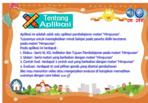
Gambar 16. Sebelum perbaikan pada kata asing yang dimiringkan dan akhir kalimat diberi tanda (.)