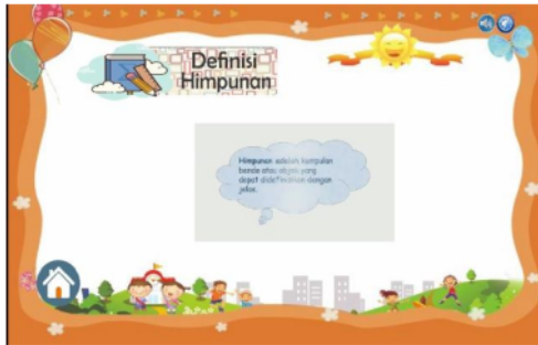
Gambar 8. Sebelum perbaikan pada materi yang disajikan